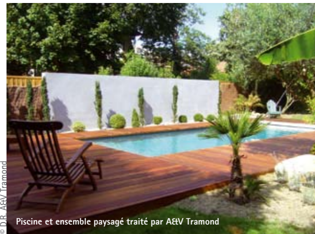
Piscine et ensemble paysagé traité par A&V Tramond

Les frères jumeaux, Antoine et Vincent Tramond, à la tête de l'agence d'architecture A&V Tramond veulent vous faire voir 2 fois plus loin ! Tous deux, architectes installés depuis 2003, ont rassemblé leurs compétences pour optimiser leurs performances.